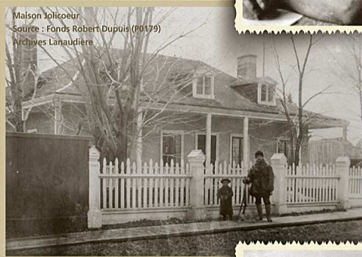
Maison Jolicoeur